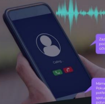
Ukázka podvodného telefonátu

Dobry den, jsem Jan Novak z oddělení bezpečnosti vaší banky. Omlouvám se, že vás vyrušuji takto pozdě večer. Dovolal jsem se paní Marii Krásové s běžným účtem č. 123456789/0 u Rodinné banky?